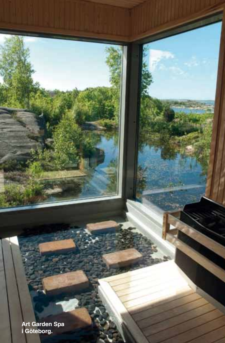
Art Garden Spa i Göteborg.