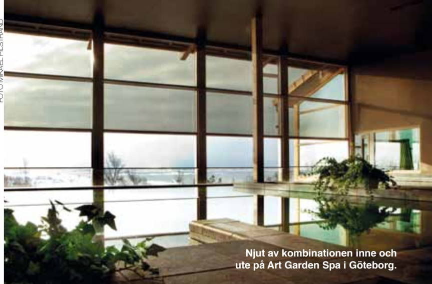
Njut av kombinationen inne och ute på Art Garden Spa i Göteborg.