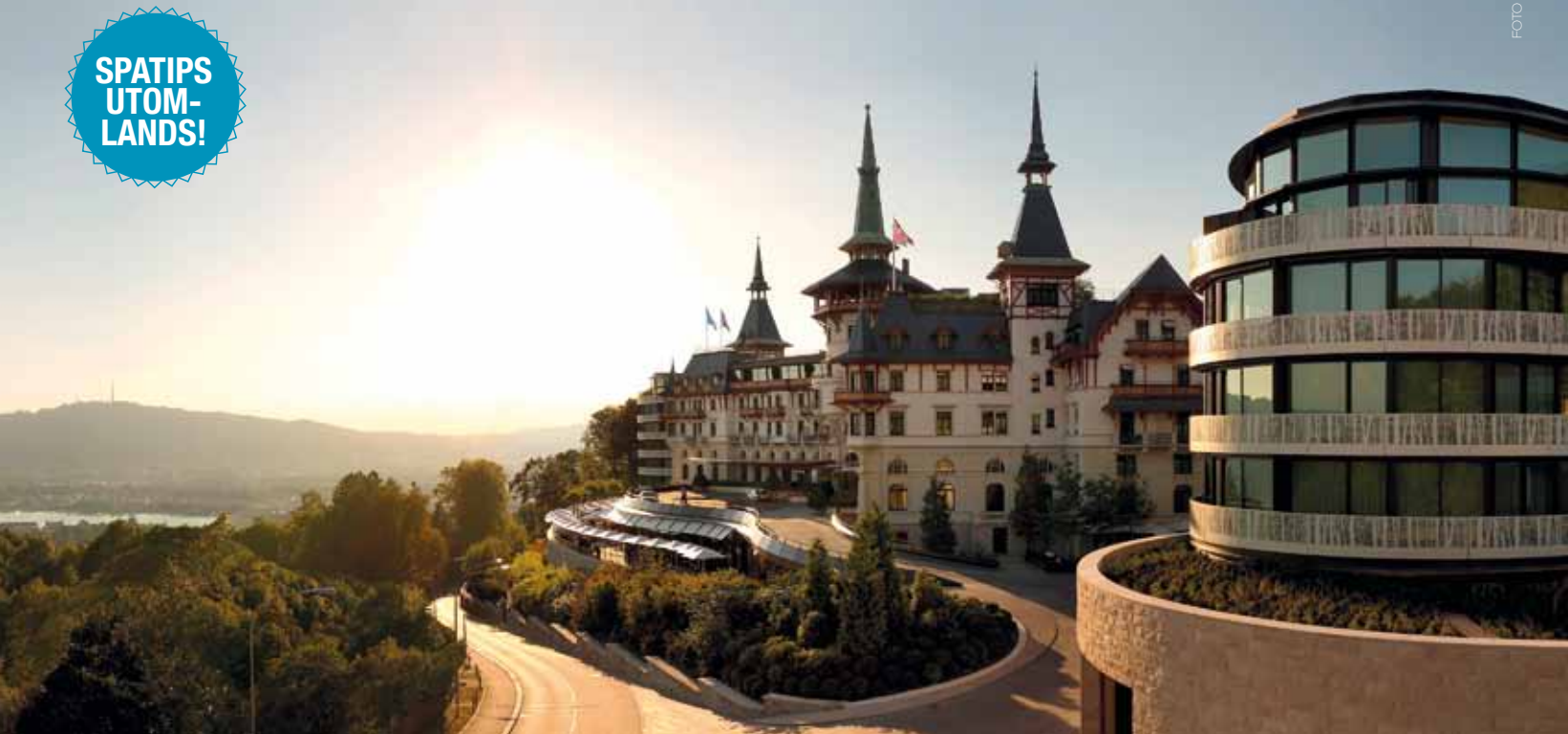
The Dolder Grand, Zürich.