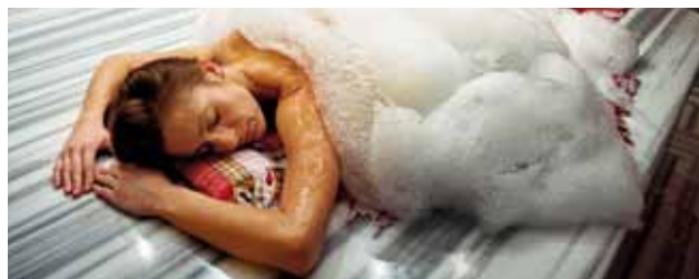
Avstressande på Blue Hamam Spa, Lidingö.