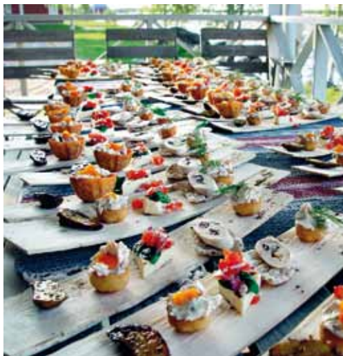
Kulinarisk upplevelse vid Kukkolaforssen.