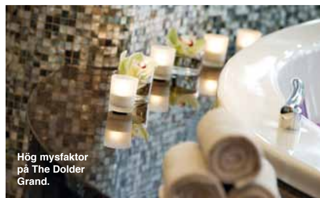
Hög mysfaktor på The Dolder Grand.

www.thedoldergrand.com (klicka på Spa). □